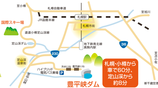
レストハウス だむみえ〜